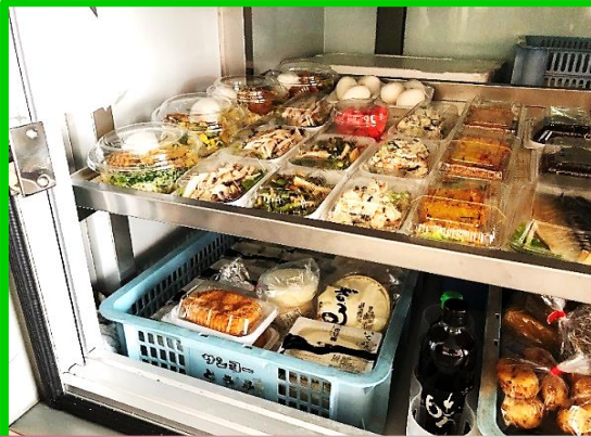
豆腐屋さん:毎週月曜日 13時頃