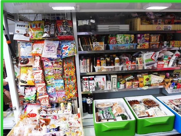
とくし丸さん:毎週水曜日 13時頃

◎特徴◎岡山にとっても馴染みのあるメルヘンパン。1度は皆さん食べたことがあるパンが沢山あります。季節限定のパンも豊富にあります。