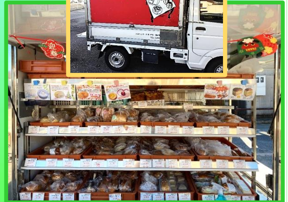
メルヘンさん:毎週水曜日 11時頃