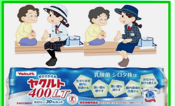
ヤクルトさん: 毎週 月～金曜日 10時頃

スーパーマーケットがそのままナーシングへ来てしまいます。何を買おうか頭もフル回転です!!