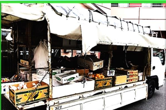
八百屋さん:毎週金曜日 13時頃